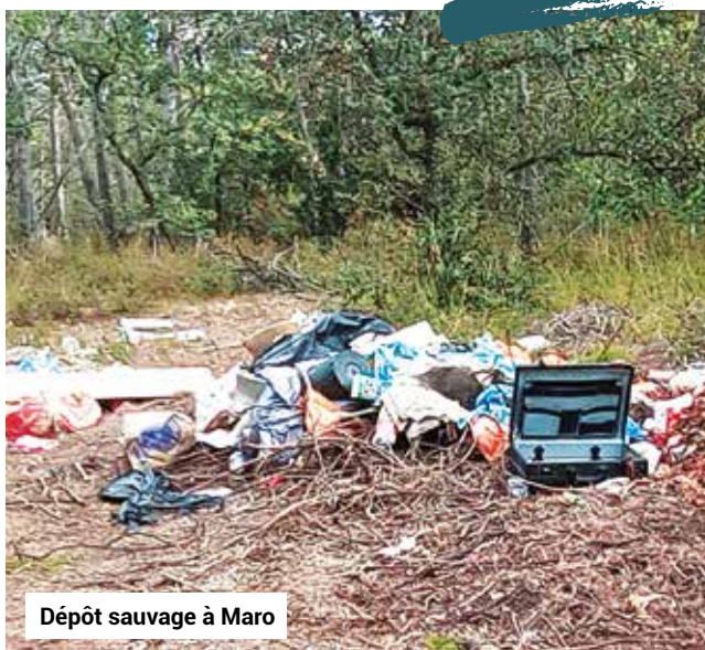
Dépôt sauvage à Maro