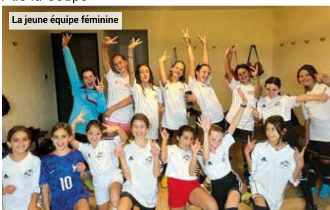
La jeune équipe féminine