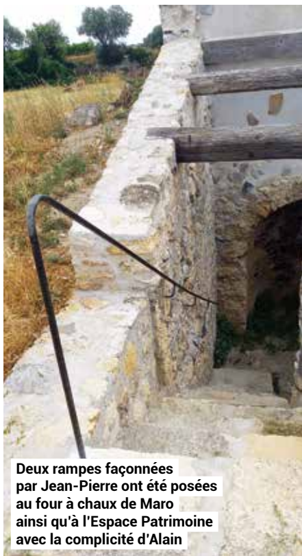
Deux rampes façonnées par Jean-Pierre ont été posées au four à chaux de Maro ainsi qu'à l'Espace Patrimoine avec la complicité d'Alain

Beaucoup de bruit dans mon escalier cette année, j'ai compté au moins 800 personnes qui ont gravi les 142 marches et ont écouté mon histoire grâce à l'audio-guide en trois langues en plus du Français (Allemand, Anglais, Espagnol).